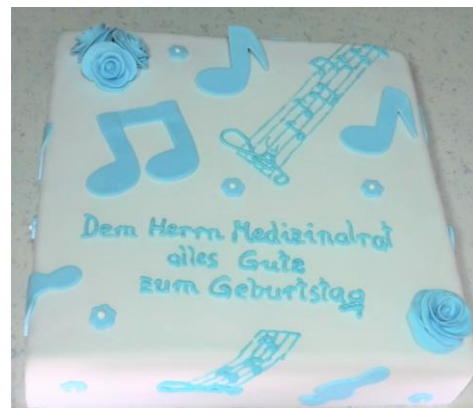
Wunschmotiv für Musiker

Blumen und Verzierungen fertige ich in Handarbeit aus Zuckermasse oder Marzipan.