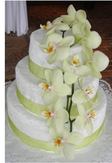
Orchideen - Torte (Nussmasse)

Torten, Kuchen und Kekse mache ich auch gerne für Allergiker (z.B. ohne Nüsse, Mehl)!