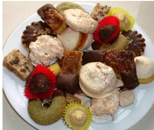
Ein bunter Teller