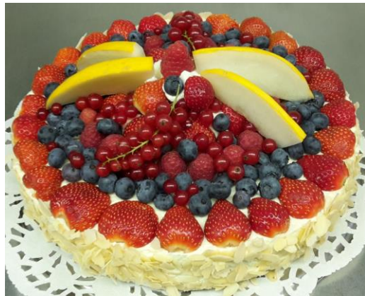
Beerenmix-Torte (helles Biskuit, Oberscreme)