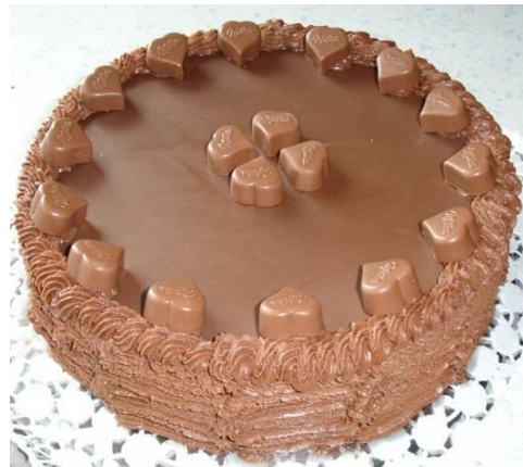
Milkatorte (Nussmasse ohne Mehl, z.B. glutenfrei)