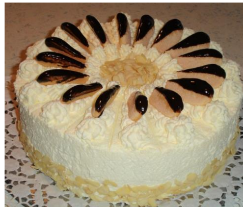
Malakofftorte (heller Biskuitboden, Biskotten)