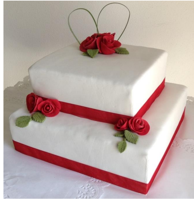
Rote Rosen - Torte (Sachermasse, handgefertigte Marzipanrosen)