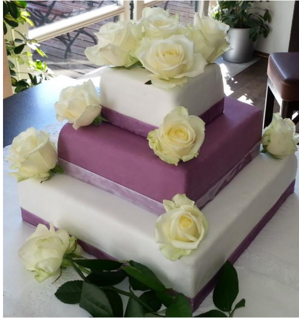
Weißer Rosen - Torte (helles Biskuit)