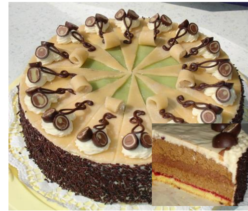
Mozarttorte (Nougatfüllung, mit Marzipan verziert)