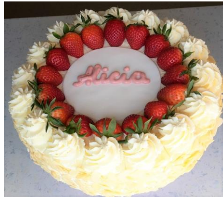
Erdbeertorte (helles Biskuit)