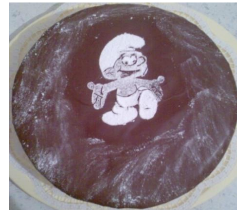
Schlumpftorte (mit handgemaltem Staubzucker-Bild)