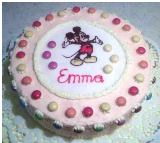
Mickymaus-Torte (für die Kleinen aber auch die Großen)