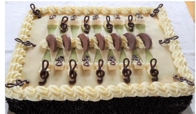
Musikerschnitte (helles Schokobiskuit, Rumobers mit Rosinen)