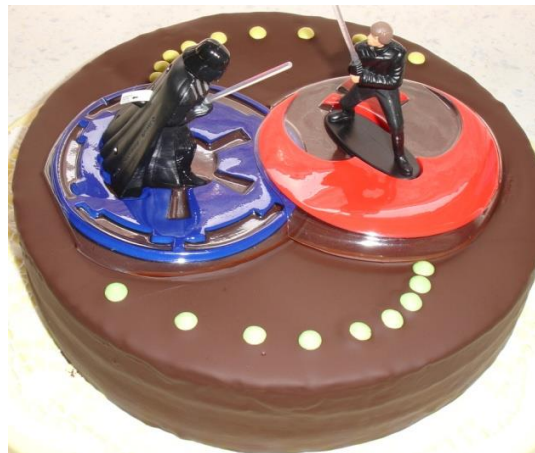
Star Wars - Torte (Schokomasse)