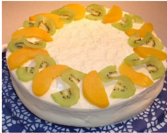
Topfen-Joghurt-Torte (helles Biskuit)

... für Auge & Seele, speziell aber für den Gaumen!