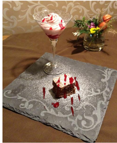
Schoko-Nuss-Brownie mit Dirndlmousse