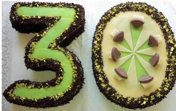
Geburtstagstorte (leichte Schoko-Sandmasse, Mürbteigboden, Marzipan)