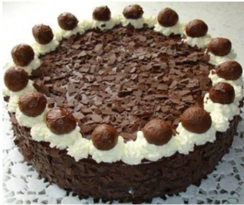
Trüffeltorte (leichte Sachermasse)