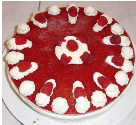
Himbeer-Mohntorte (Mohnmasse mit Schlagobers)