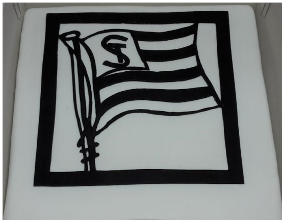
SK Sturm - Torte