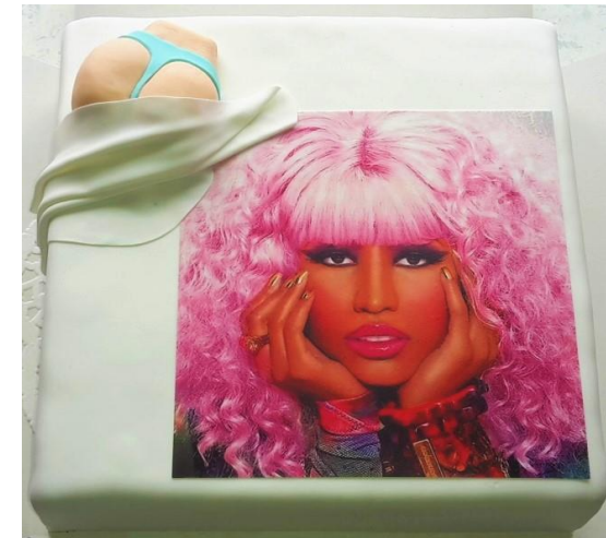
Torte mit Erdbeercreme