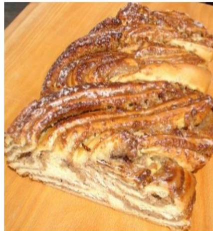
Nuss- und Mohnstriezel