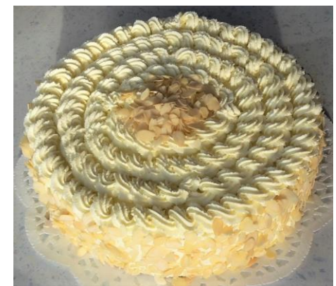
Topfentorte (helles Biskuit)